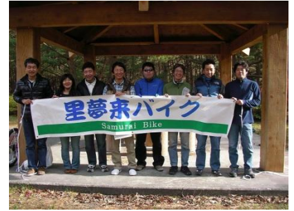
併催の自転車さんぽ参加者も交えて。