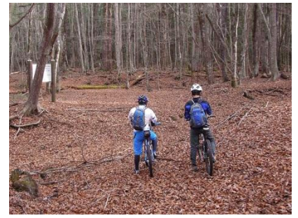
SS1 から SS2 へのロングリエゾン。