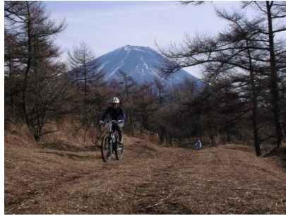
富士を背景にした SS3。