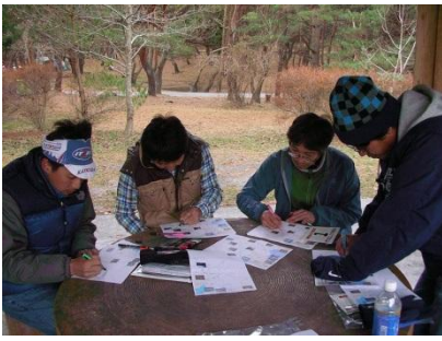
集合場所の本栖湖キャンプ場。