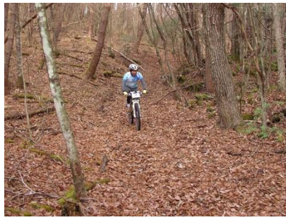
SS1 で使用した林道本栖線。